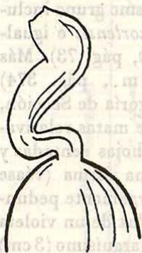
Fig. 2. - Estilo de Viola cazorlensis . Según Brc-KRR.

tos (véase MELCHIOR, 1925, p. 104-107). Es decir por la forma biológica (sufrútice); por las hojas estrechas y enteras; por las pequeñas estípulas enteras tendiendo a bracteiformes; por el estilo sencillo, sin asomo de formaciones apendiculares, así como por la abertura estigmática absolutamente desprovista de pico.