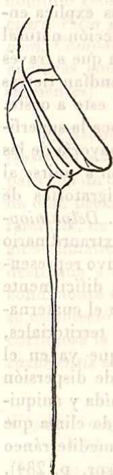
Fig. 1. — Espolón estaminal de Viola cazorlensis . Según BECKER.

La Sec. Delphiniopsis , lo mismo que la Sección Xylinosium , representan, sin duda, grupos de parentesco filogenéticamente muy antiguos. Ello viene comprobado por su estructura morfológica relativamente primitiva en diversos espec-