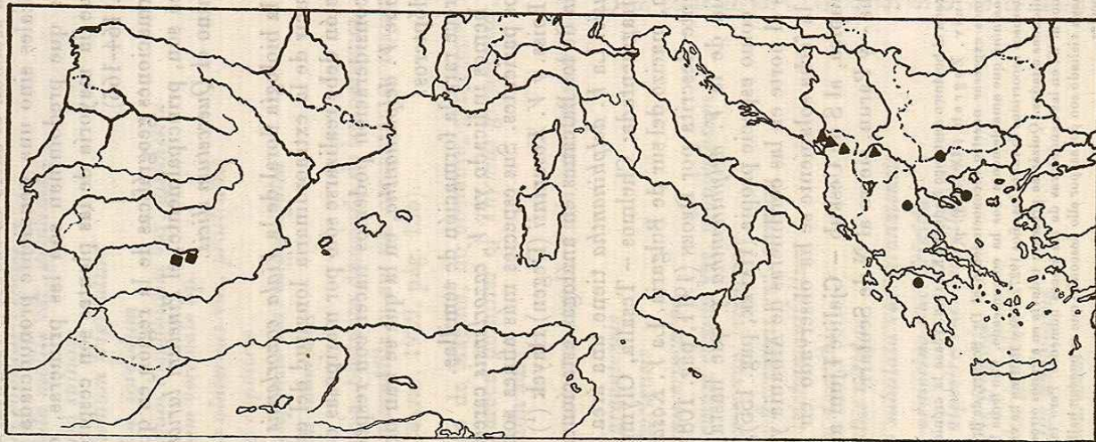
Distribución geográfica de las Viola cazorlensis ■, V. Kosaninii ▲ y V. delphinantha ●.