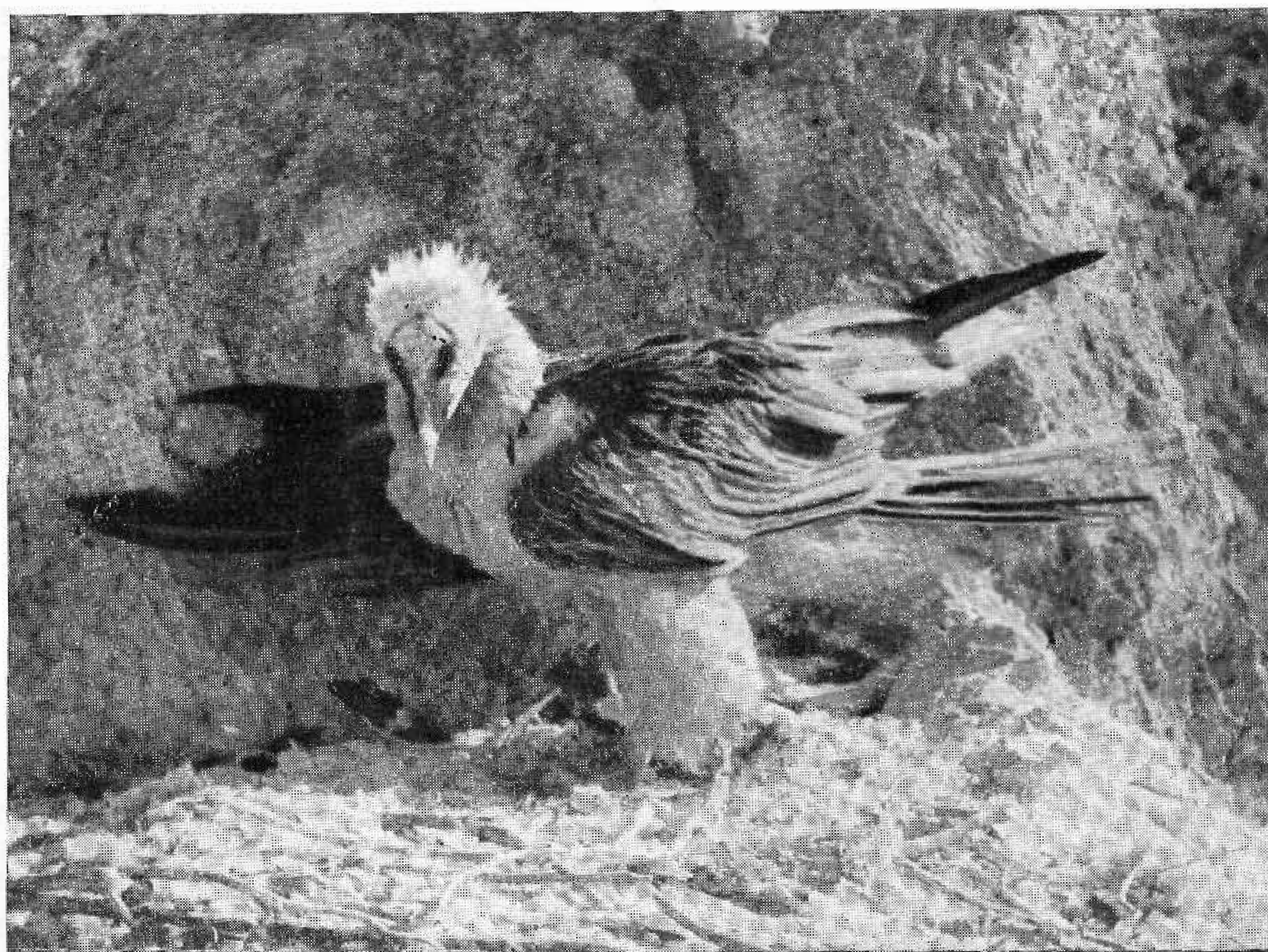
El Quebrantahuesos ( Gypaëtus barbatus ) sorprendido en su nido de la Sierra de Cazorla (Jaén). Arriba, adulto a la izquierda y pollo ya muy crecido a la derecha; abajo, adulto en primer término, cubriendo al joven, que asoma un poco a la izquierda.